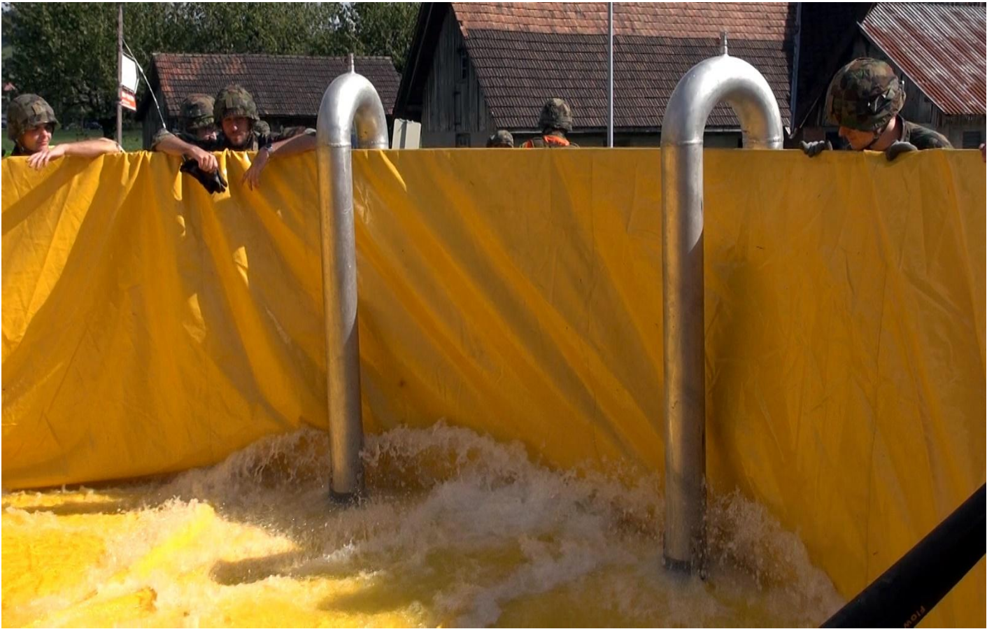
Ausgleichsbecken für 50 m 3 Wasser