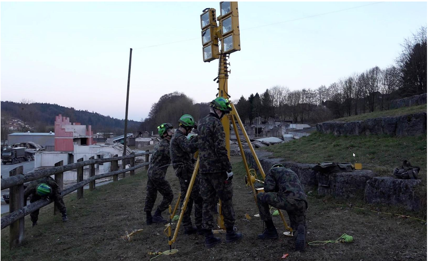
Beleuchtung deckt die Grösse von zwei Fussballfeldern ab.