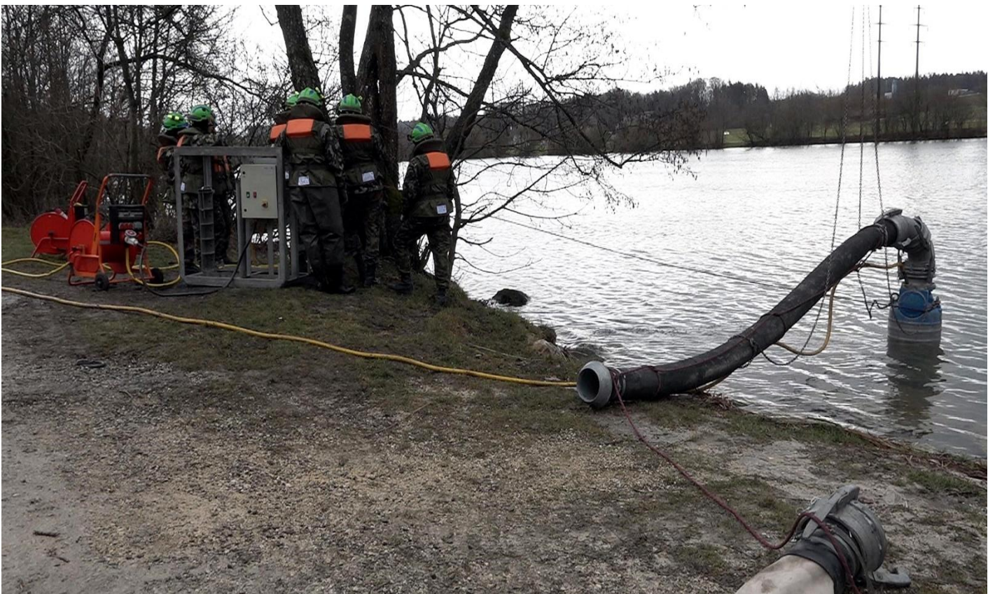
Wasserpumpe Förderung 10`000 Liter pro Minute