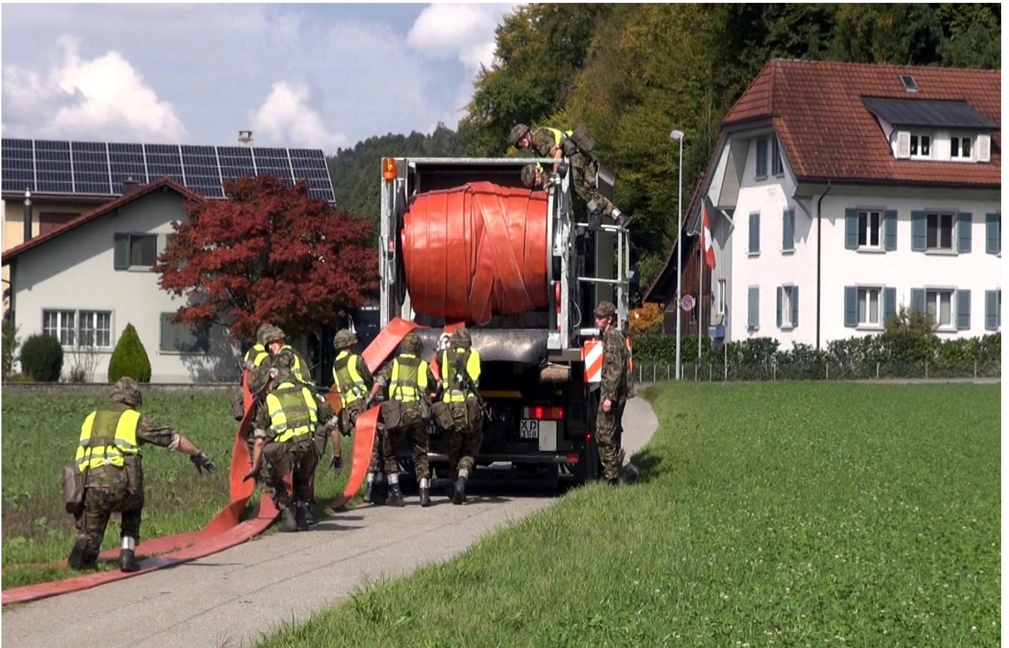
Erstellen eines Wassertransportes