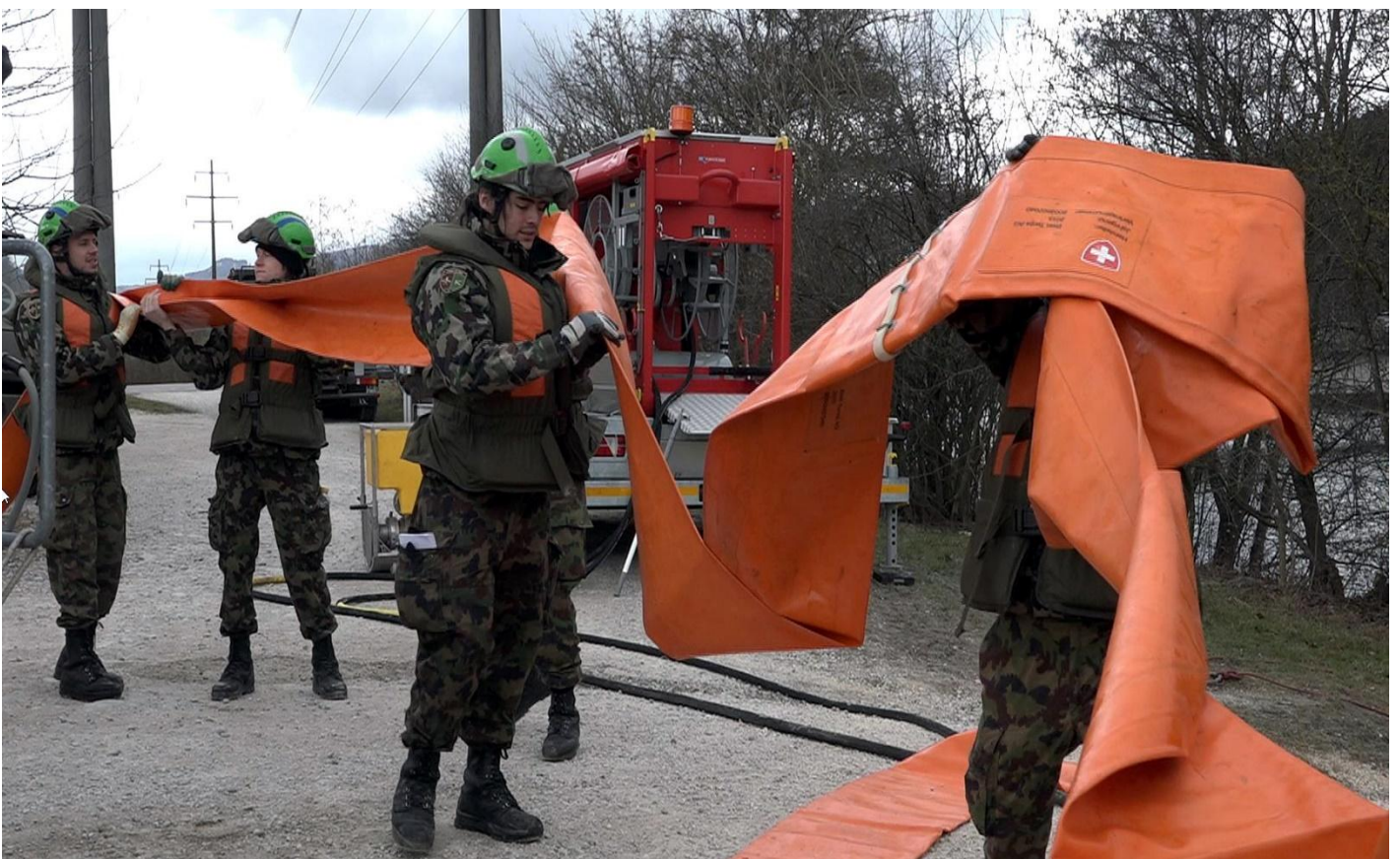
Die neuen 300 mm Wassertransportschläuche